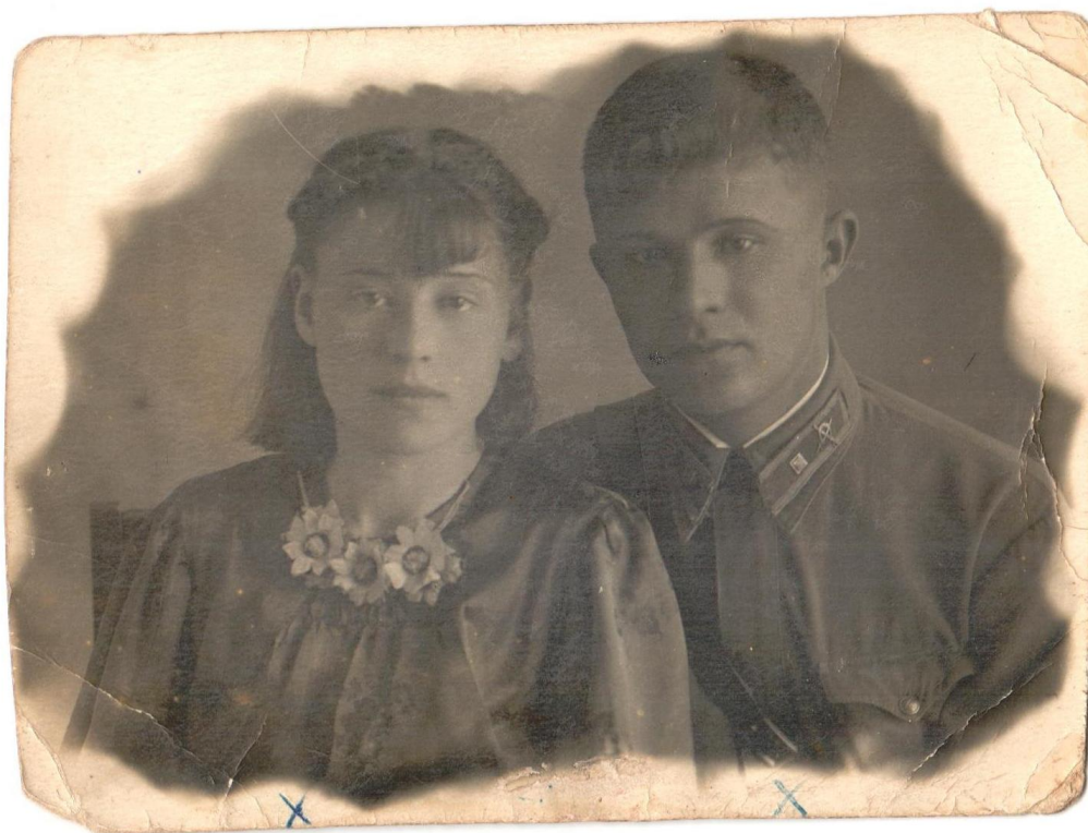
Фото 2. Прадедушка и прабабушка 1942г.

И именно здесь, в г. Татарске прадед познакомился со своей будущей женой, моей прабабушкой.