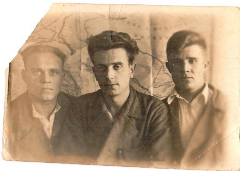
Фото1. Прадедущка в госпитале (крайний справа). 1942г

В этих боях под Клином мой прадедущка получил ранение в голову и спину. Был контужен, временно потерял память. Лечили его в различных госпиталях, последний из которых находился в городе Омск Новосибирской области.