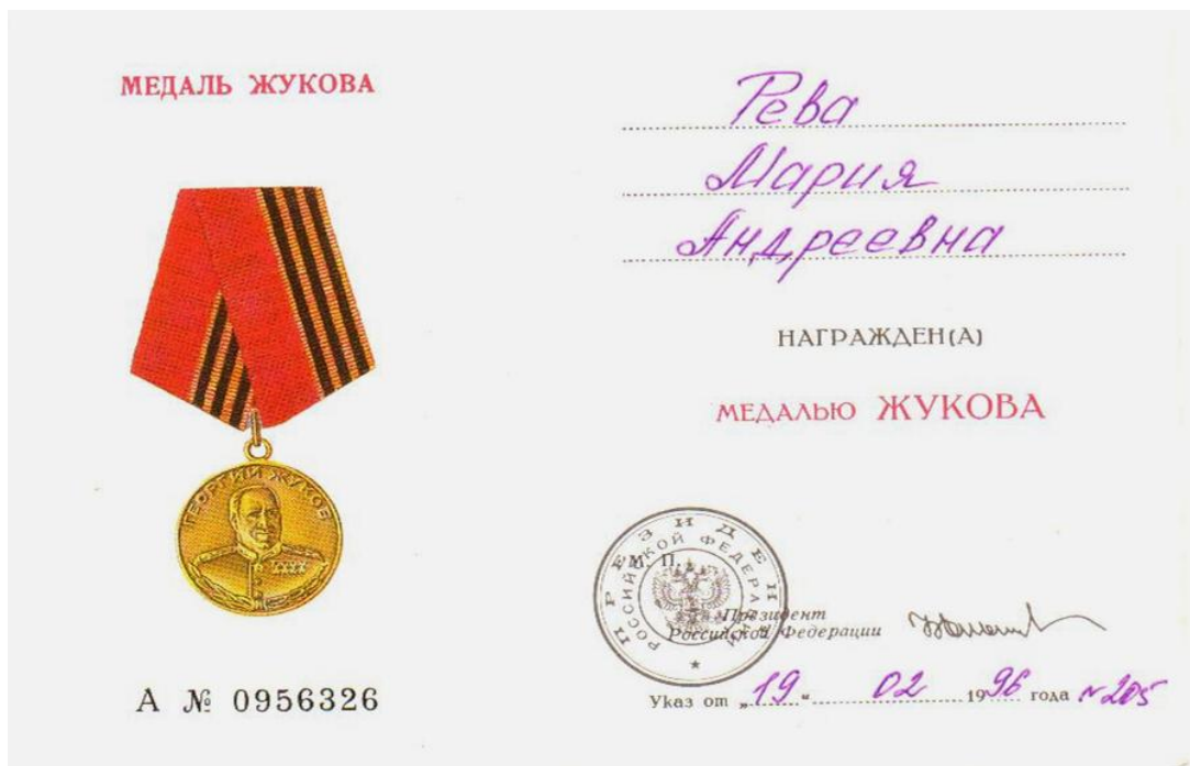
Рис. 6 Копия удостоверения к медали Жукова

В феврале 1996 года моя прабабушка получила медаль имени маршала Жукова (рис. 6)