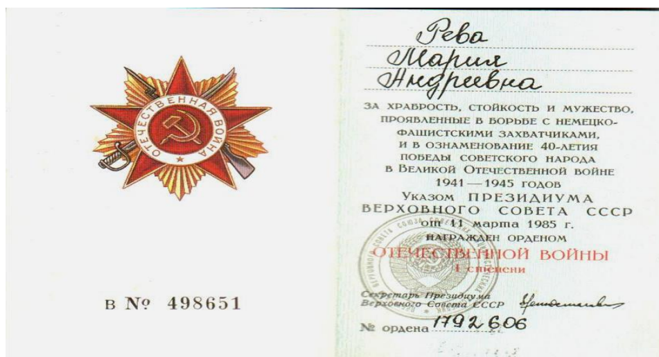
Рис. 5 Копия удостоверения к Ордену Отечественной войны I степени