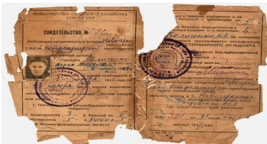
Рис. 3. Свидетельство об окончании Новочеркасской ветфельдшерской одногодичной школы