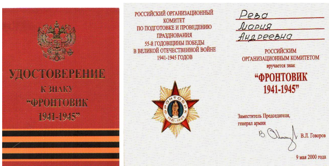
Рис. 7 Копия удостоверения к знаку «Фронтовик 1941-1945»

9 Мая 2000 года на параде в честь 55-летия Великой Победы прабабушке вручили нагрудный знак «Фронтовик 1941 - 1945». (рис. 7)