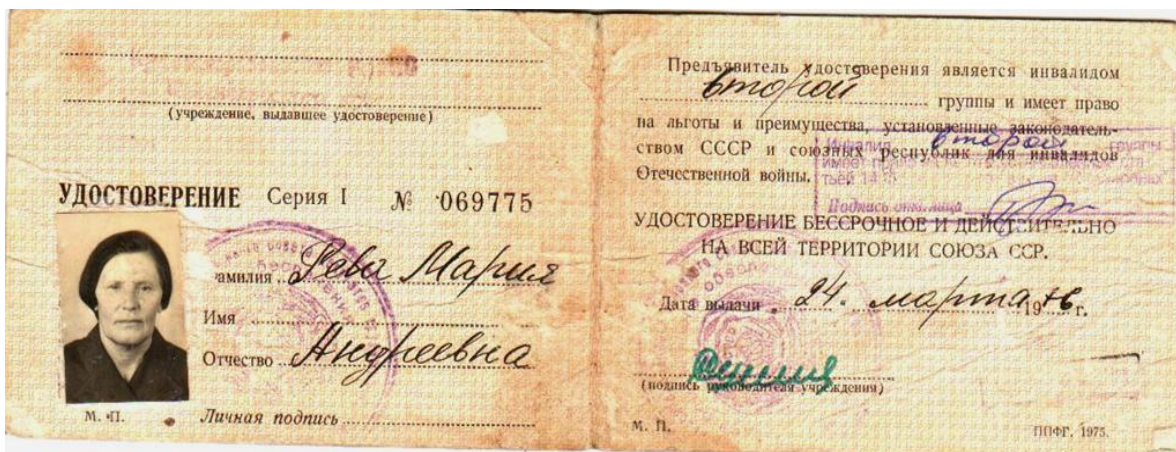
Рис. 2 Копия удостоверения инвалида Отечественной войны

За время боевых действий с марта 1942 по август 1944 года, моя прабабушка была награждена многими медалями и благодарностями от командования дивизии. Целый год прабабушка скиталась по госпиталям Сибири. День Победы встретила в госпитале Иркутской области. Из госпиталя она вышла инвалидом Великой Отечественной войны (рис. 2)